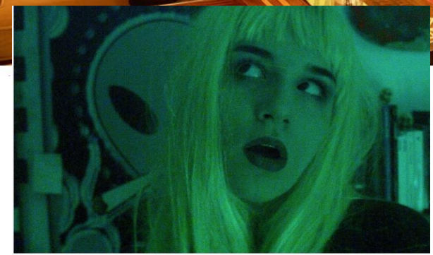
Nacional Noticias Rizha estrena su nueva canción «Cute Bitch»